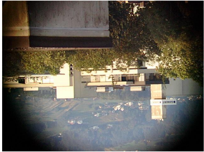
Das auf dem Kopf stehende Bild mit einer leichten Beugung am linken oberen Rand

Der Adapter dient auch als Makroring mit manuellem Fokus, sofern ein 2" Adapter für die Kamera vorhanden ist. Ein mattschwarzer Anstrich der Adapterinnenseite ist dann wegen den Reflexionen nötig.