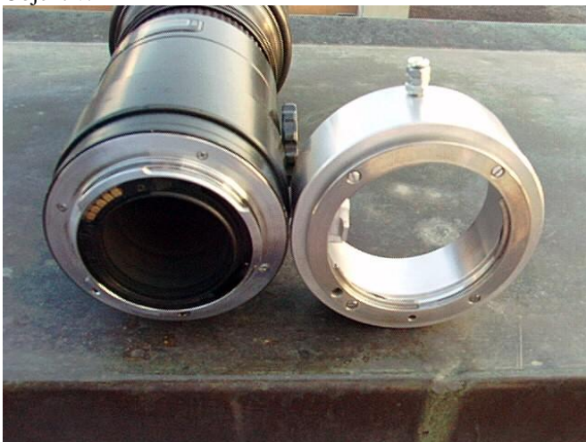
Das Tele neben dem Adapter Das Tele neben dem Adapter